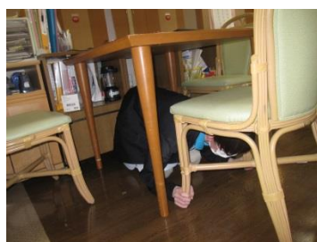
『素早く行動介護職員』