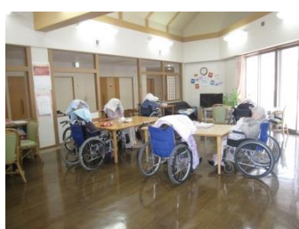
『頭を守る利用者さん達』

○ 素早く身を隠す。命を守る。60秒を刻みます。施設長のお手本でした (・ω・)♪