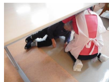
『利用者さんと職員と一緒に』