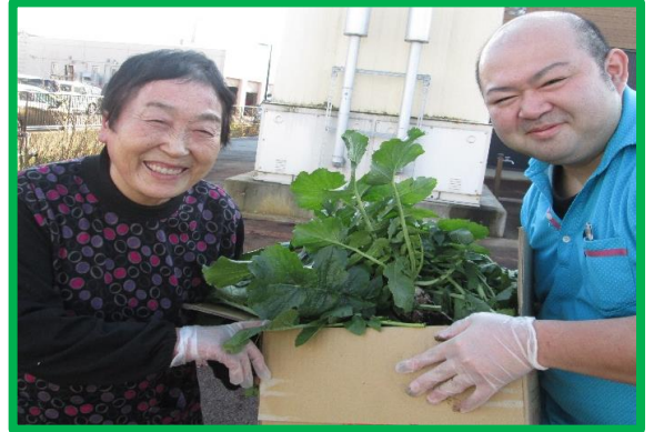
11月27日、生活介護事業所において、ありかりファームで大根の収穫を行いました。 収穫した大根は、ホタテと和えてサラダにして、みんなで美味しくいただきました。