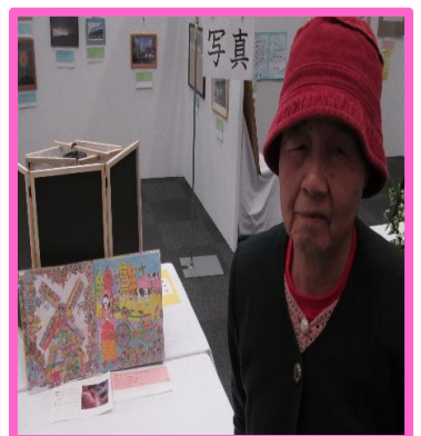
11月29日、生活介護事業所で、こころいきいき芸術文化祭に行ってきました。 各自、この日のために作品を製作し、出品しました。 自分の作品を見た後は、今年度賞を受賞している作品をよく鑑賞してきました。