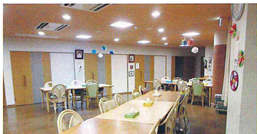
落ち着いた雰囲気のお部屋で1日のんびりと過ごして頂けます。