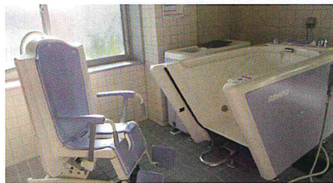
安楽にご入浴いただける設備を備えております。