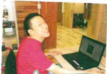
パソコンで長編小説を執筆中。