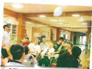
集団レクリエーションで「風船バレー」をしています。盛り上がっています!