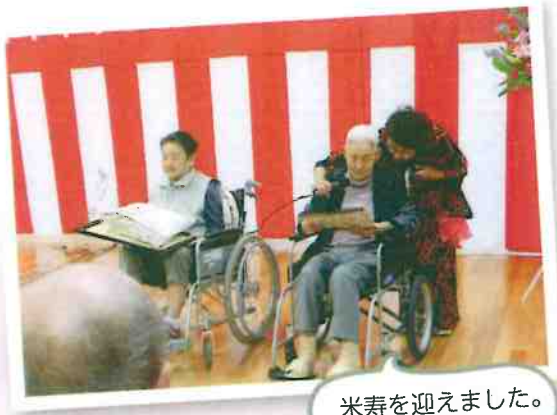
米寿を迎えました。

グループホームとは認知症の症状を持ち、病気や障害で自宅での生活に困難を抱えた高齢者が、専門スタッフの支援を受けながら共同生活をする介護福祉施設です。 今年4月より、1ユニット増床となり、2ユニット男性3名女性15名の計18名の利用者様が生活しています。 ドライブや夏祭りを楽しんだり、風船バレーなどのレク、手伝いを通して認知症の進行を穏やかにして、明るく、時には賑やかに過ごしております。