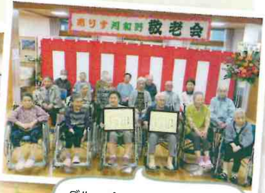
グループホームの皆で記念写真