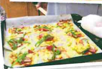
「シュー皮ピザ」を作りました。アツアツのできたてで大好評でした!