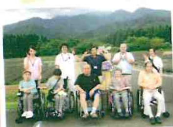
ラベンダー園でラベンダーの香りに癒されました。