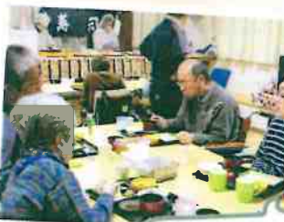
寿司バイキング～おいしかった～♪