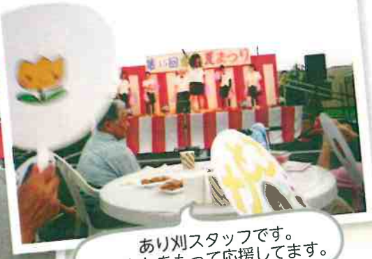
ありがとうスタッフです。うちわをもって応援してます。