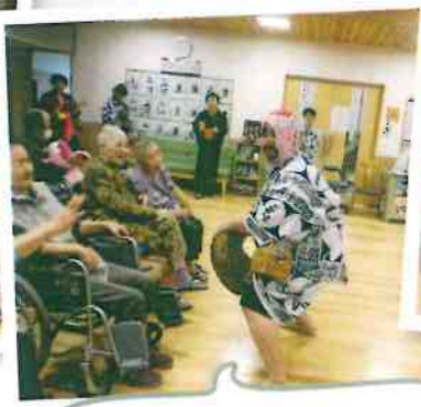
おや～ドンジョすくい来た～(笑)