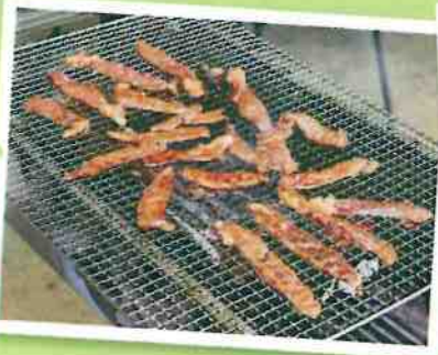
野外バーベキュー会