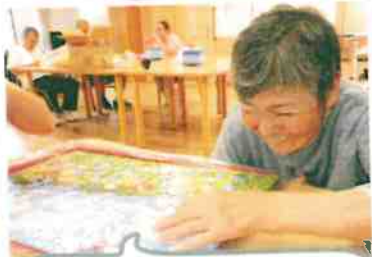
創作活動でパズルにチャレンジしています。ピースがはまってにっこり!