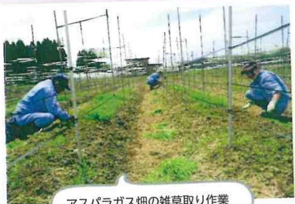
アスパラガス畑の雑草取り作業