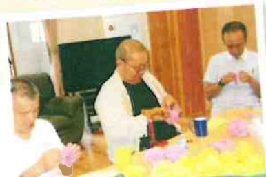
施設行事に向けての飾り作り。