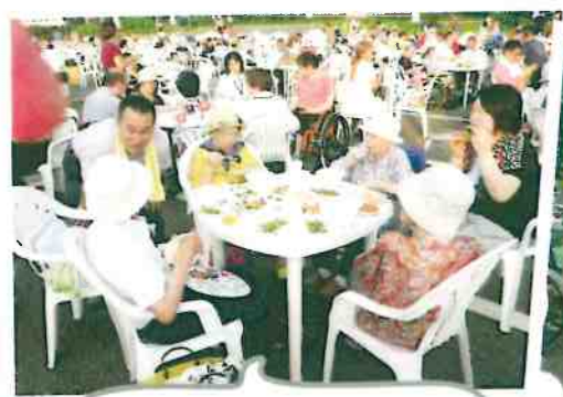
外で食べるがら、んめな～