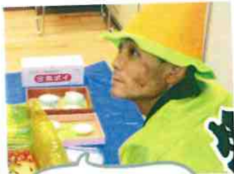
第1回おもてなし祭り ～金魚すくい担当～

ユアホーム単独では大曲イオンに買い物に行きた他は、休日におやつを作って食べるなど小さな動きが中心でしたが、初めてホットケーキを焼いて食べた時にはリビング中に広がる甘い香りを喜んでもらえたり、何を付けて塗って？乗せて？食べるのが世代によって違う事で盛り上がった、楽しい時間を共有させていただいています。