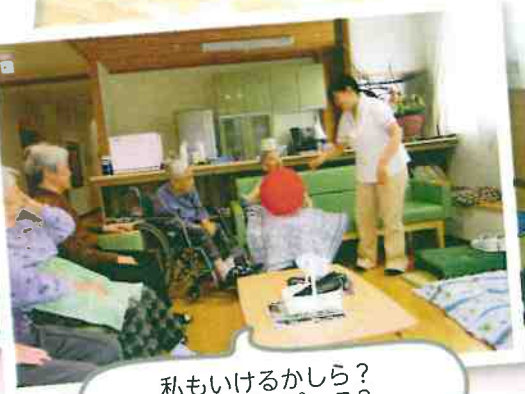
私もいけるかしら？東京オリンピック？