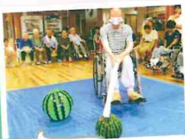
スイカ割り大会。どれが本物のスイカかな〜?