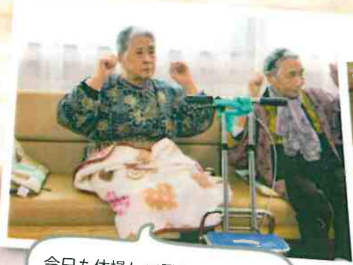
今日も体操して元気に頑張るべ