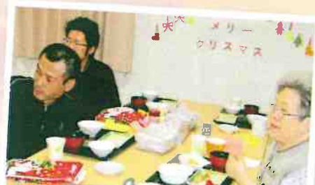
サンタさんごちそうさま♪