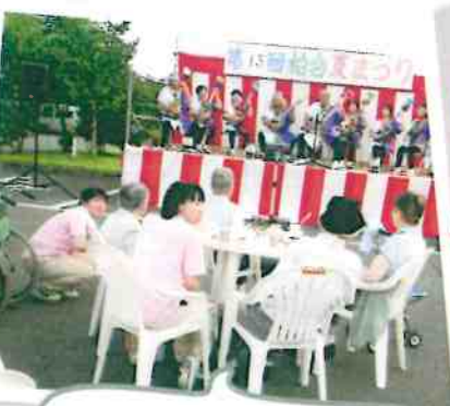
特等席でスコップ三味線堪能