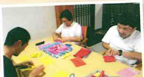
おもてなし祭りの準備頑張ってます！