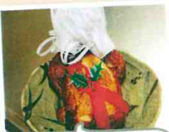
クリスマスにサンタさんから プレゼントが届きました