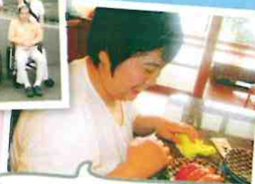
ドライブで「回転寿司 函太郎」に行ってきました。大好きな寿司を前に、嬉しそうな笑顔です。