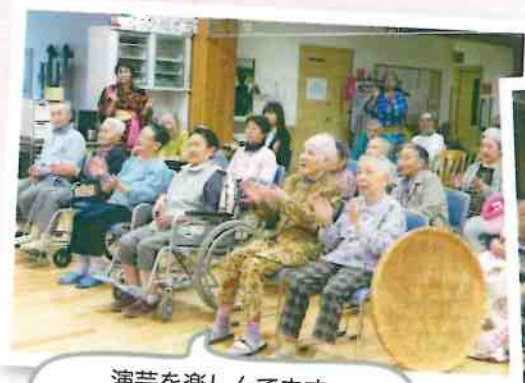
演芸を楽しんでいます。何が起きるか楽しみだ～

グループホームとは認知症の症状を持ち、病気や障害で自宅での生活に困難を抱えた高齢者が、専門スタッフの支援を受けながら共同生活をする介護福祉施設です。 今年4月より、1ユニット増床となり、2ユニット男性3名女性15名の計18名の利用者様が生活しています。 ドライブや夏祭りを楽しんだり、風船バレーなどのレク、手伝いを通して認知症の進行を穏やかにして、明るく、時には賑やかに過ごしております。