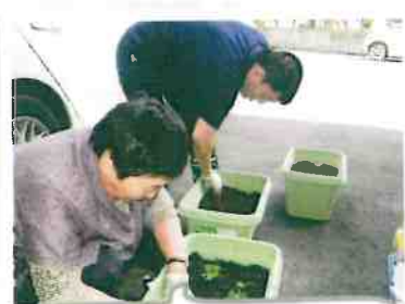
園芸活動で「苺」を植えました。来年の春が楽しみです。早く大きくな〜れ!