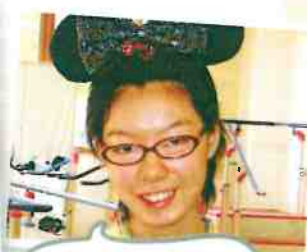
第1回おもてなし祭り ～受付嬢～